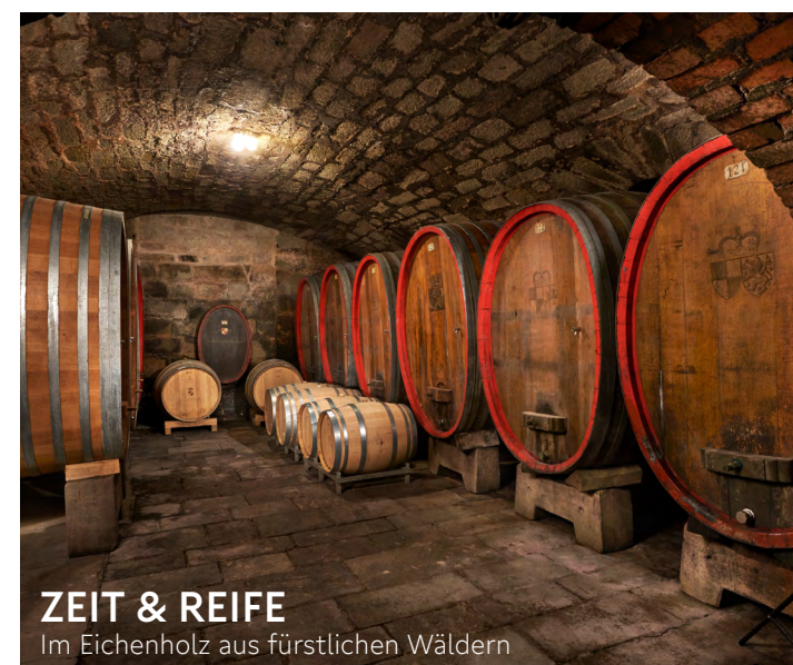
ZEIT & REIFE Im Eichenholz aus fürstlichen Wäldern