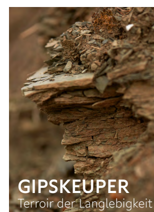
GIPSKEUPER Terroir der Langlebigkeit