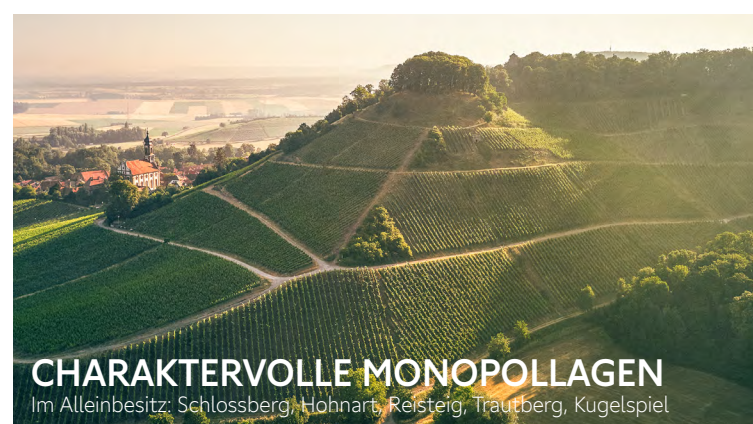
CHARAKTERVOLLE MONOPOLLAGEN Im Alleinbesitz: Schlossberg, Hohnart, Reisteig, Trautberg, Kugelspiel